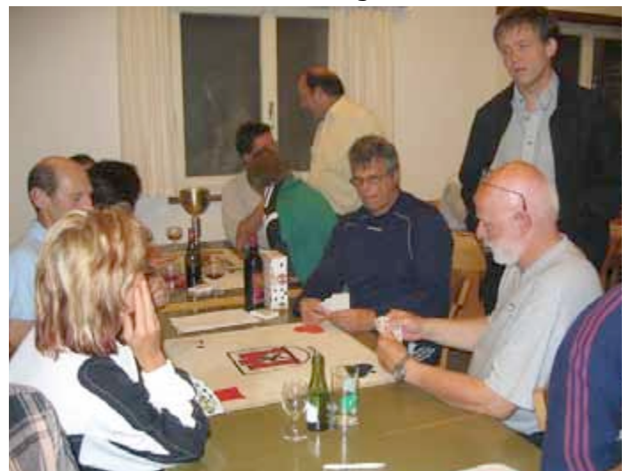
Und kaum war die Rangverkündigung des Jasstennis-Masters 2007 vorbei, fing das Spielen wieder von vorne an...